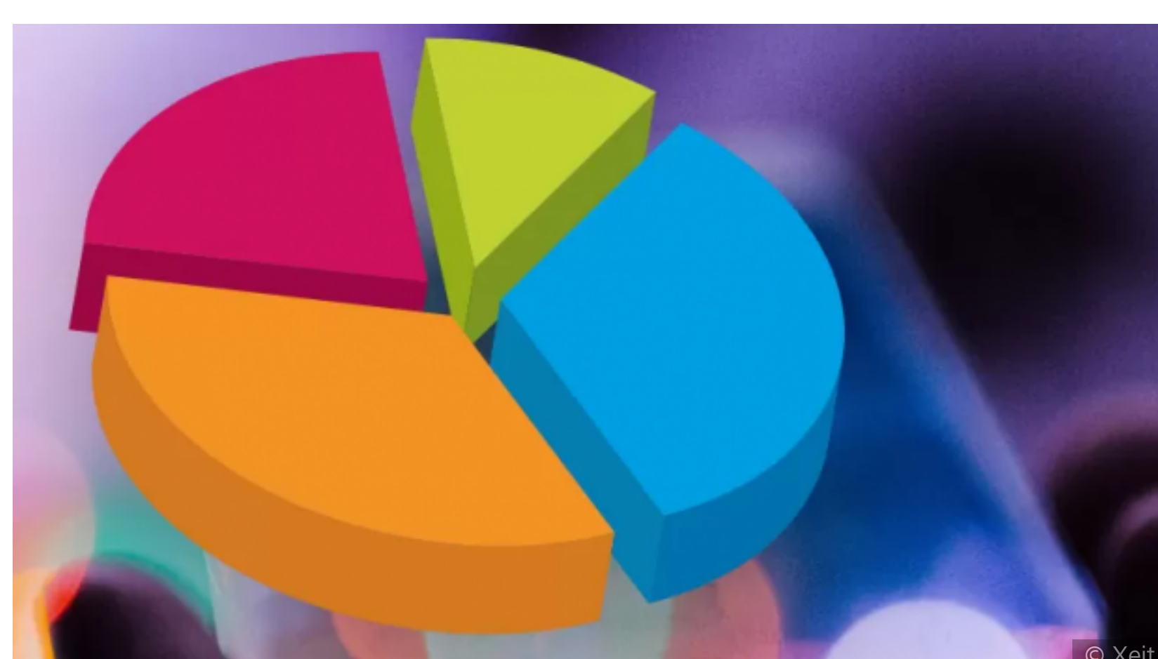
Über fünf Stunden verbringen Schweizer Jugendliche täglich am Smartphone

von Michael Reidel Mittwoch, 10. Februar 2021