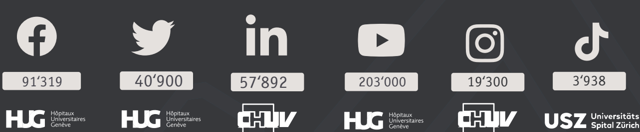
Nutzerzahlen pro Plattform

Schweizer Spitäler mit den meisten Nutzern pro Plattform